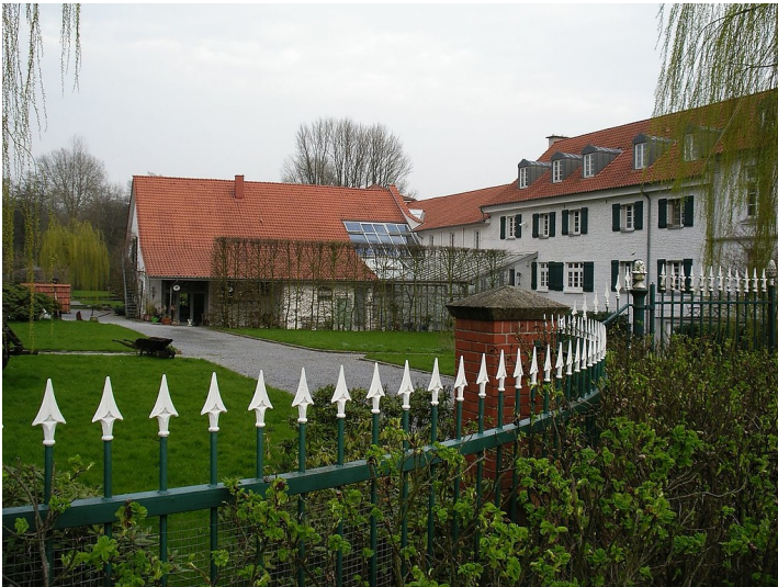
Hofanlage des Hauses Morp bei Erkrath (2006).