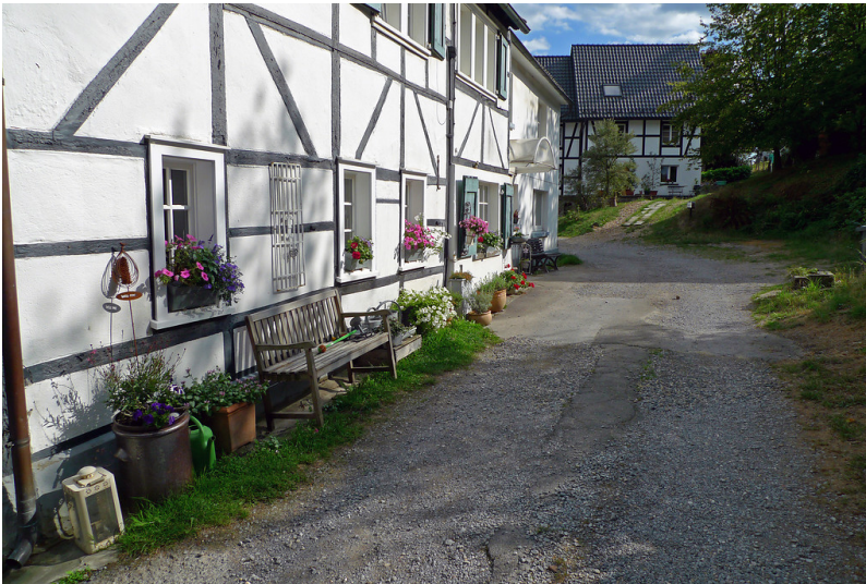
Hofschaft Buscher Feld in Solingen (2019)