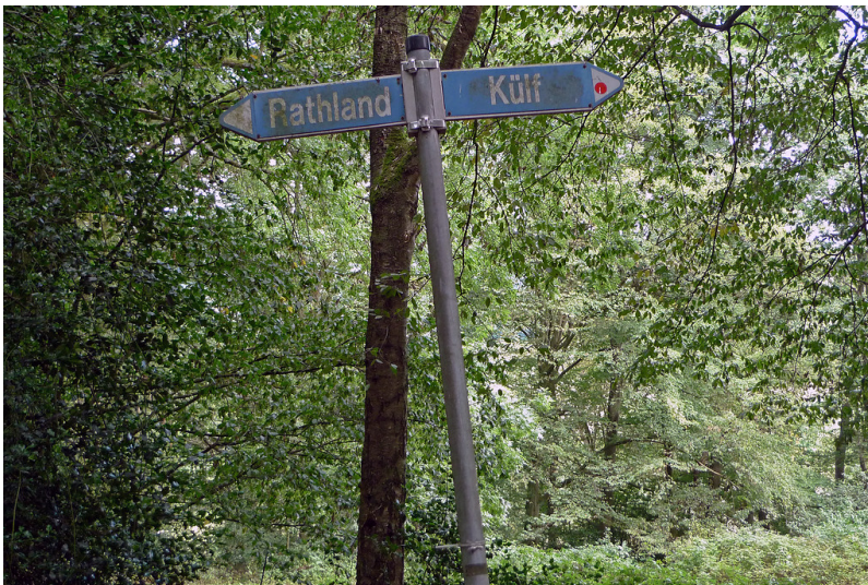
Wegweiser zur Hofschaft Külf (2019)