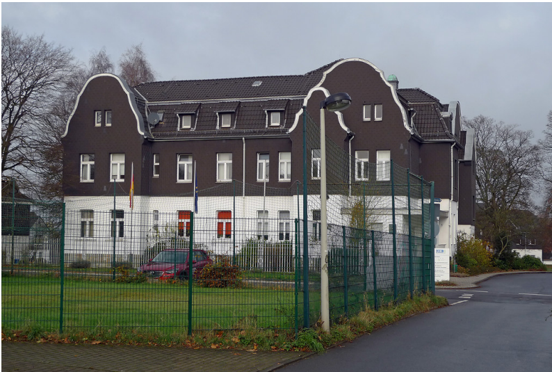
Halfeshof in Solingen, Einrichtung der LVR-Jugendhilfe Rheinland (2016)