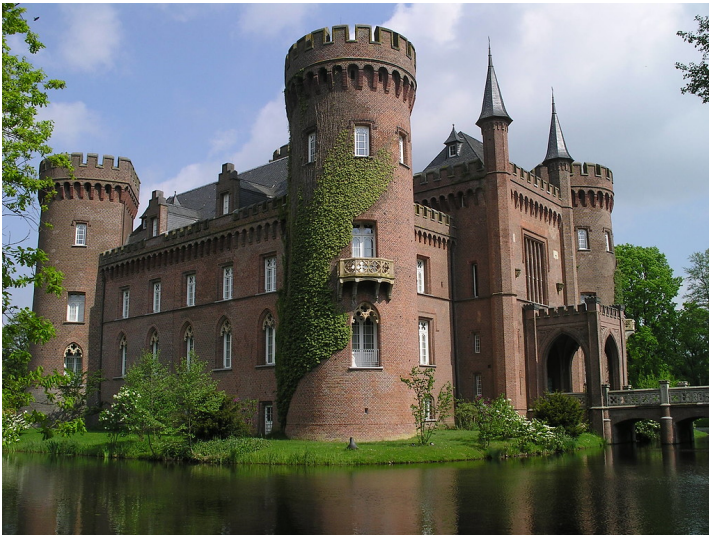
Schloss Moyland in Bedburg-Hau mit Wassergraben