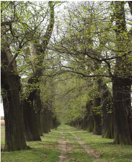
Blick in die Kastanienallee bei Schloss Dyck, Jüchen (2010)