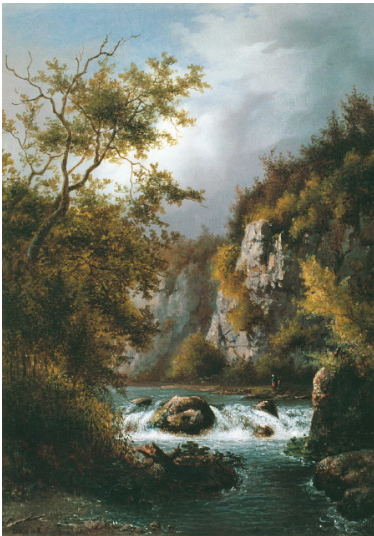
Barend Cornelis Koekkoek, Gezicht in het Neanderdal, Ölgemälde, 28 x 21,5 cm, 1843, Stiftung B. C. Koekkoek-Haus, Kleve. Fotograf/Urheber: Koekkoek, Barend Cornelis