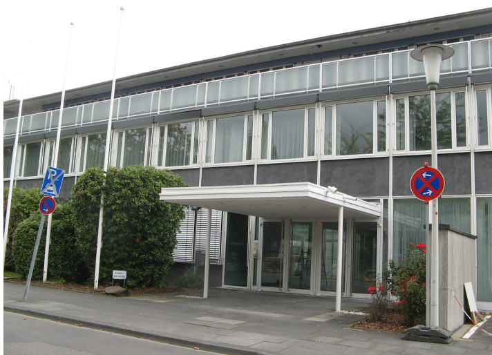
Die Eingangsseite der ehemaligen Landesvertretung Bayern von der Bonner Schlegelstraße aus gesehen (2008)