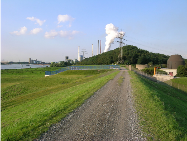
Halde Alsumer Berg in Duisburg-Bruckhausen (2007)