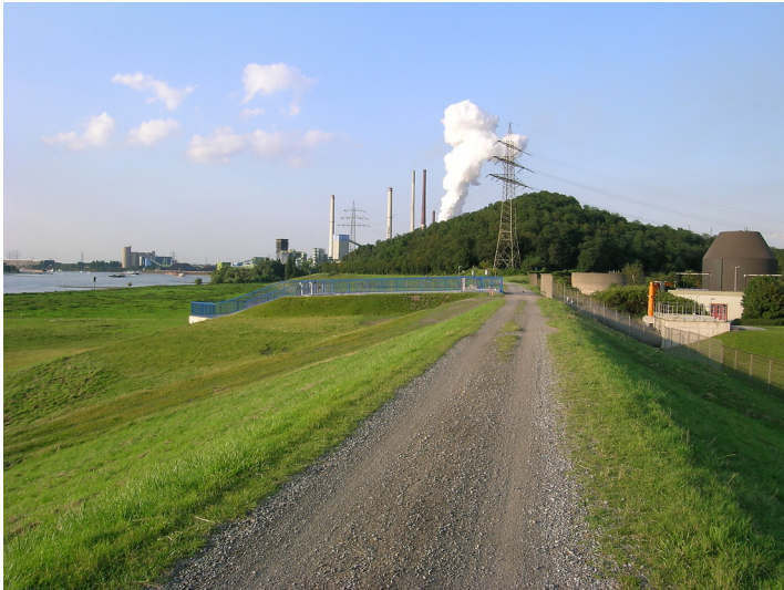
Halde Alsumer Berg in Duisburg-Bruckhausen (2007)