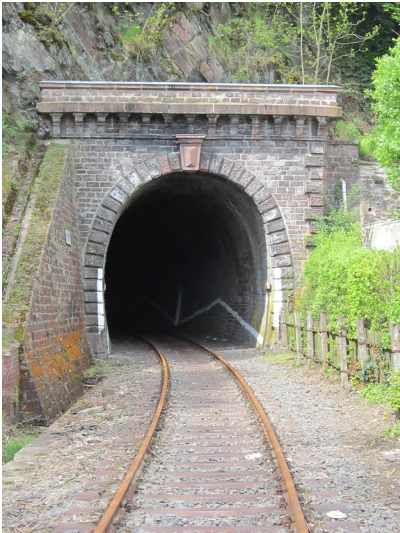
Tunnelportal Gemünder Tunnel (2012)