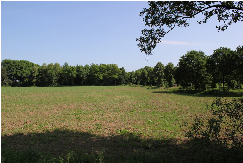
Tradierte Ackerfläche nördlich des Schlosses Diersfordt in Wesel (2012)