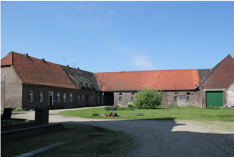
Wirtschaftshof des Schlosses Diersfordt (2012)