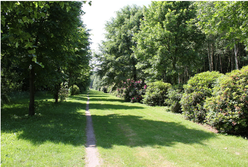
Schlosspark Diersfordt (2012)