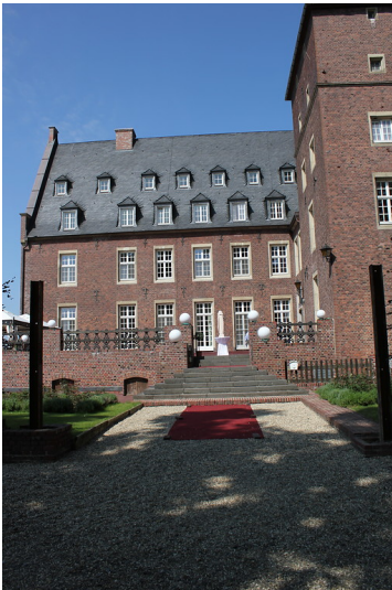
Eingangsbereich des Haupthauses des Schlosses Diersfordt (2012)