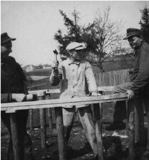
Das historische Bild aus den 1950er Jahren zeigt den Müller der Meisenthaler Mühle in Rothenbach / Meisenthal bei der Arbeit am Mühlrad.