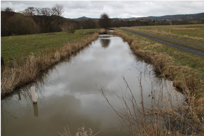
Der breit auslaufende Mühlengraben der Meisenthaler Mühle in Rothenbach / Meisenthal bei Kelberg (2013).