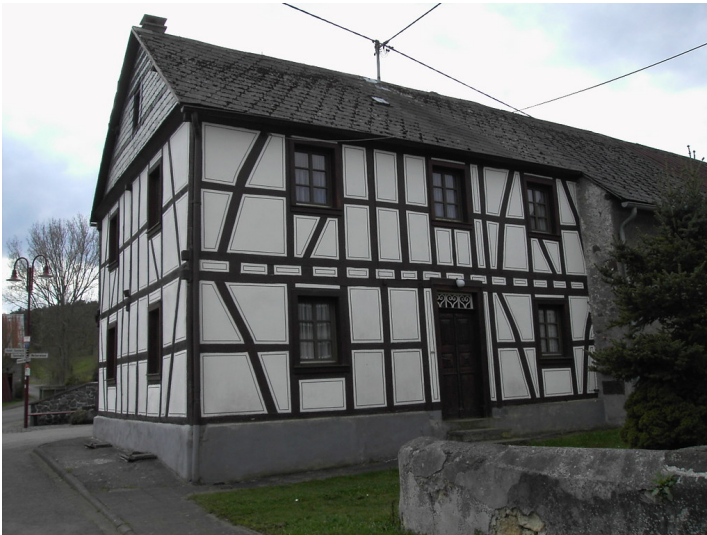
Fachwerkgebäude der Alten Post in Kelberg-Rothenbach (2008)