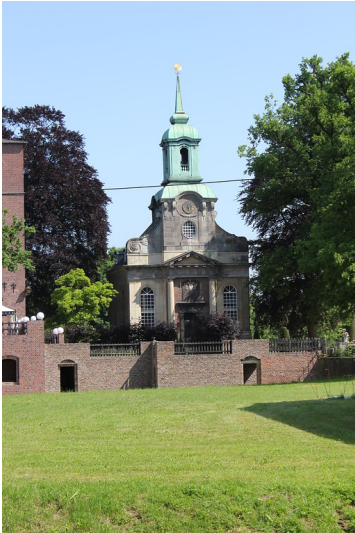
Schlosskirche Diersfordt (2012)