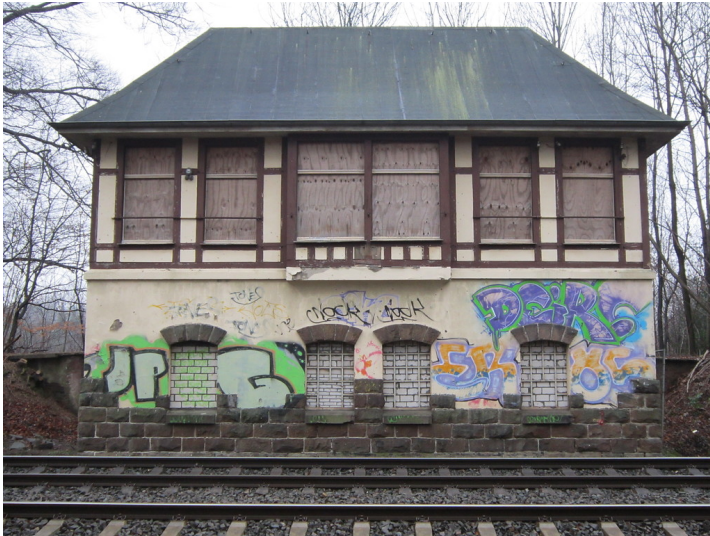
Bahnseitige Front des Stellwerkes No im Bahnhof Neanderthal (2013). Im Vordergrund die Gleise der Bahnstrecke von Mettmann nach Gerresheim