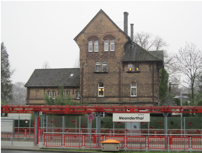
Empfangsgebäude Bahnhof Neanderthal (2013), Ansicht von der Bahnseite.