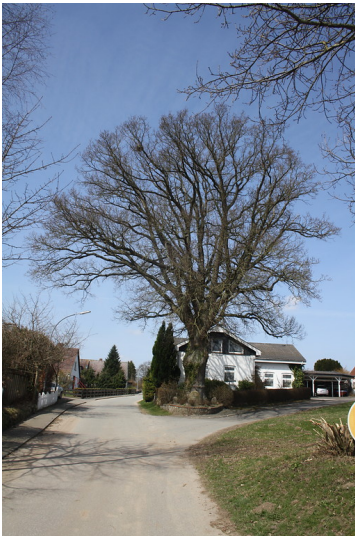
Friedenseiche in Klein Wittensee südlich der ehemaligen Schule (2013)