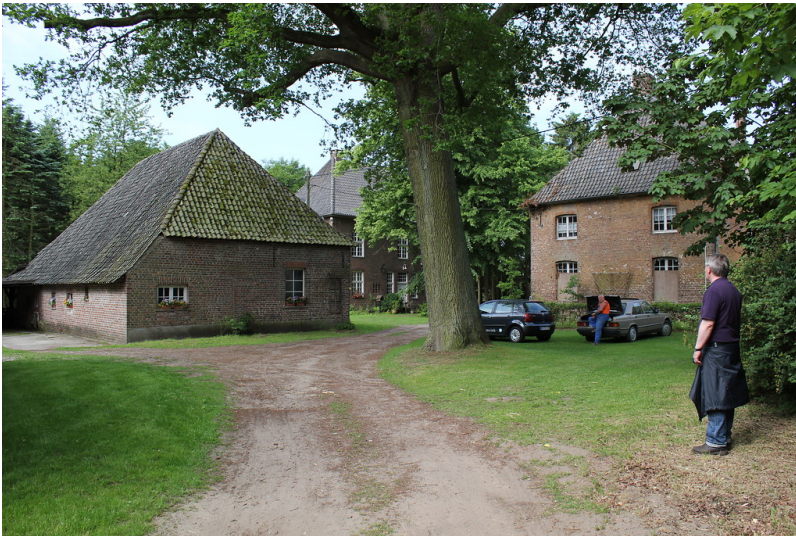
Gebäudegruppe Pastorat, Schule und Forsthaus der ehemaligen Oberförsterei von Diersfordt (2012)