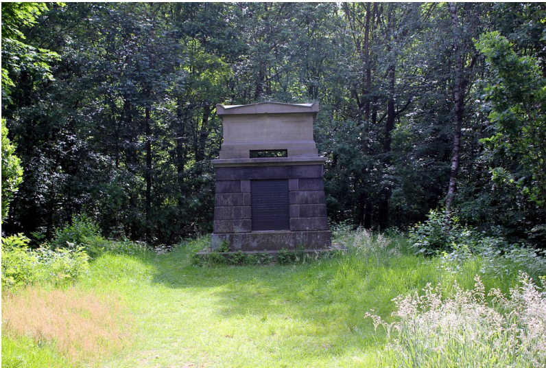
Erbbergräbnisstätte von Christoph Alexander von Wylich am Schloss Diersfordt (2012)