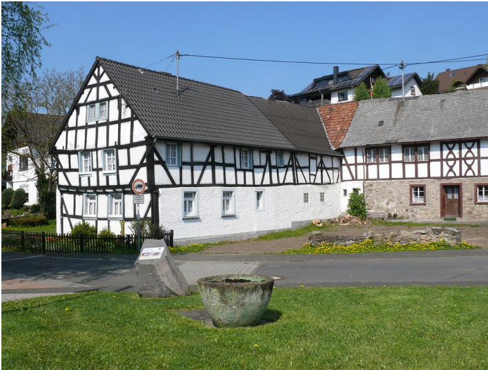
Das Kelberger Winkelgehöft (Haus Böder) (2009).