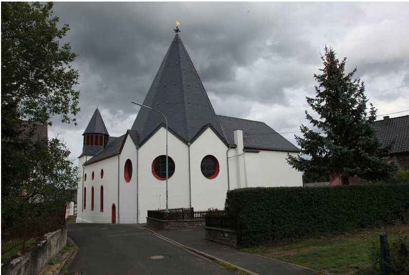
Die Katholische Pfarrkirche St. Appolonia in Kelberg-Bodenbach (2011).