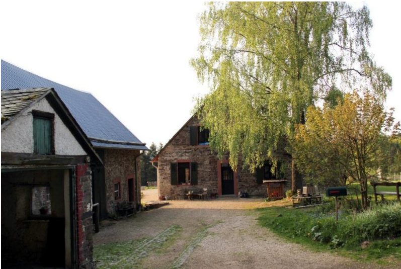
Das restaurierte Forsthaus am Barsberg in Bongard (2014)