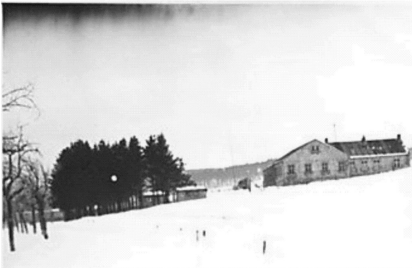
Zeitgenössisches Bild (undatiert): Das ehemalige Arbeitslager in Bongard im Winter.

Schlagwörter: Gaststätte , Arbeitslager , Wohnheim Fachsicht(en): Kulturlandschaftspflege, Landeskunde Gemeinde(n): Bongard Kreis(e): Vulkaneifel Bundesland: Rheinland-Pfalz