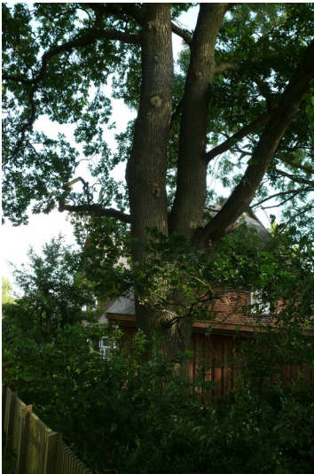
Doppeleiche bei der ehemaligen Schule in Ahlefeld-Poggensiek (2007)