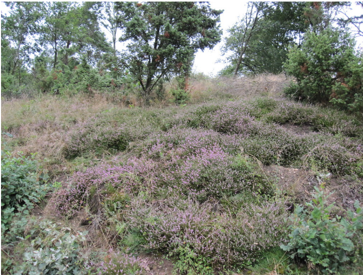
Blühende Calluna-Heide am Heidekopf in Kelberg-Zermüllen im Spätsommer 2010.