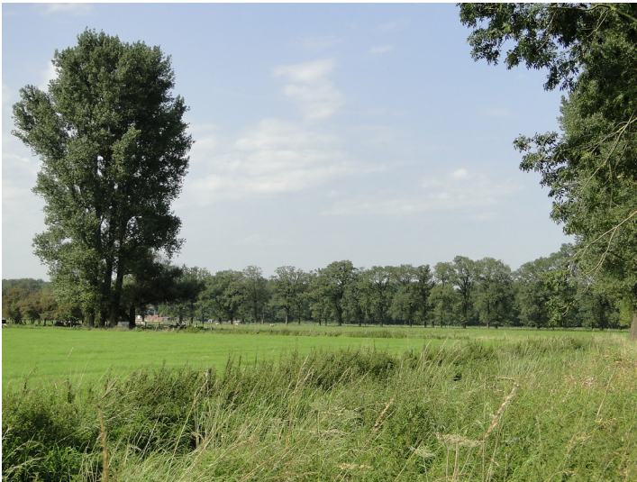
Grünland mit Gehölzstreifen und Gehölzgruppen im Uedemerbruch (2011)