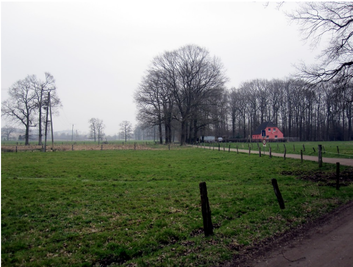
Der Kotten "Grims Kaeth" bei Haus Kolk in Uedem und die umgebenden landwirtschaftlichen Nutzflächen (2011).