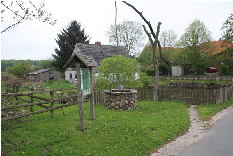
Ziehbrunnen in der Dorfstraße in Holzbunge (2013)