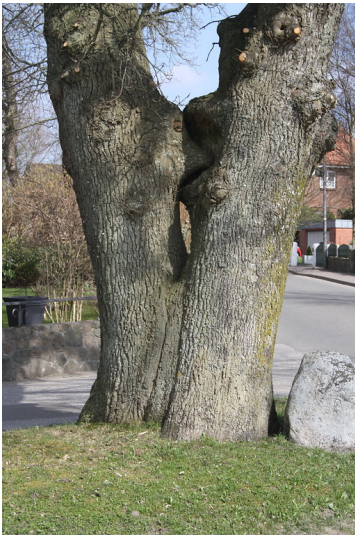
Stamm der Doppeleiche mit Gedenkstein in der Dorfstraße in Holzbunge zur Erinnerung an die Erhebung von 1848 (2013).