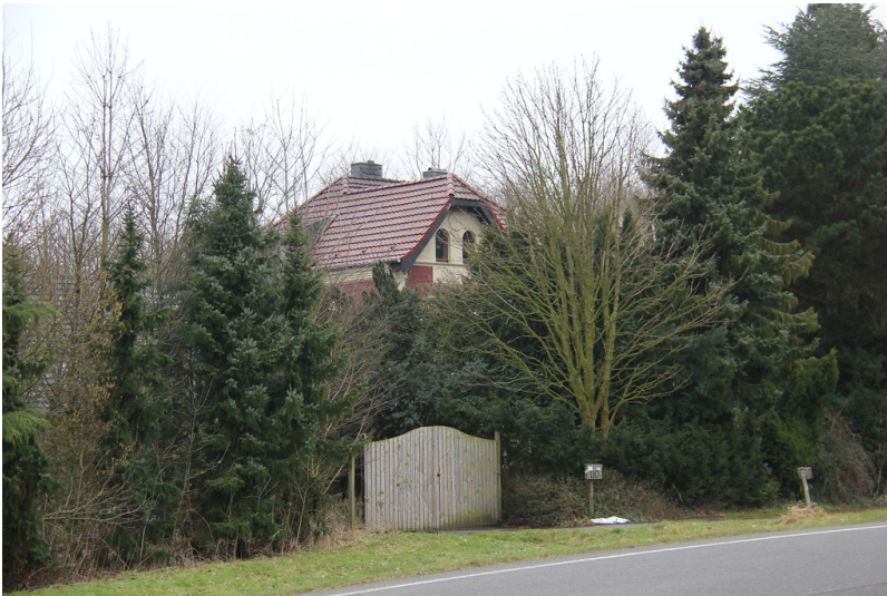
Die Villa Roeloffs in der Bergstraße in Uedemerfeld (2013).