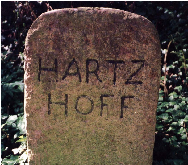
Grenzstein mit der Aufschrift "Hartzhoff" beim Harzhof auf dem alten Heerweg in Haby (2013).