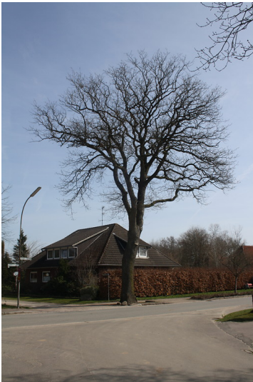
Friedenseiche in Haby, Landkreis Rendsburg-Eckernförde (2013).