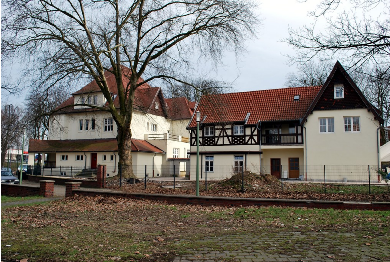
Direktorenvilla mit Kutscherhaus in der Siedlung Bliersheim, Duisburg-Rheinhausen (2013)