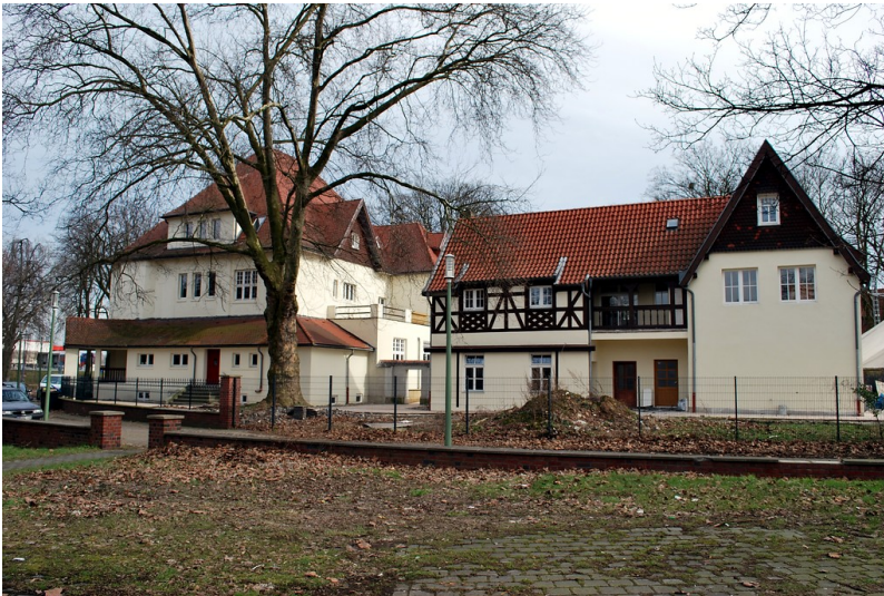
Direktorenvilla mit Kutscherhaus in der Siedlung Bliersheim, Duisburg-Rheinhausen (2013)