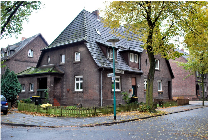
Wohnhaus in der Siedlung Zeche Wehofen in Duisburg (2012)