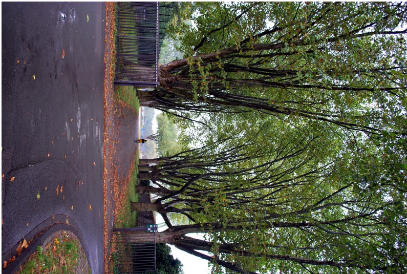
Eingang zur ehemaligen Zeche Wehofen 1/2, Duisburg-Wehofen (2012)