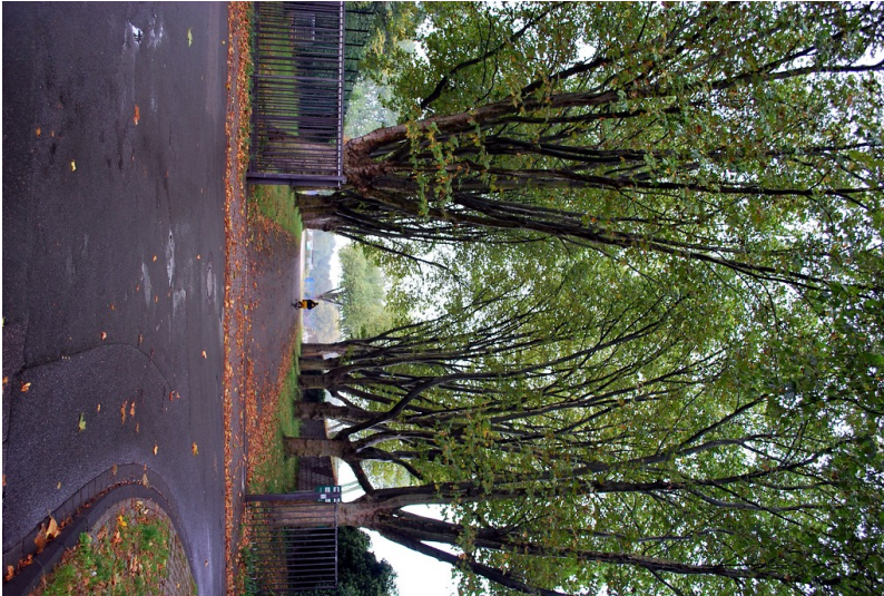
Eingang zur ehemaligen Zeche Wehofen 1/2, Duisburg-Wehofen (2012)