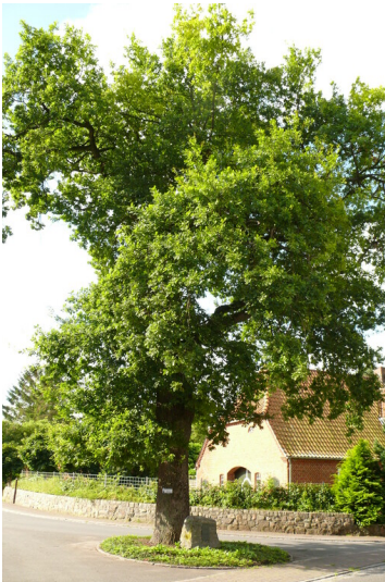
Friedenseiche in Bünsdorf (2007)