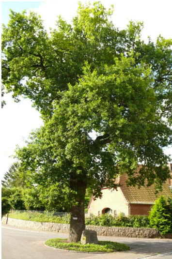
Friedenseiche in Bünsdorf (2007)