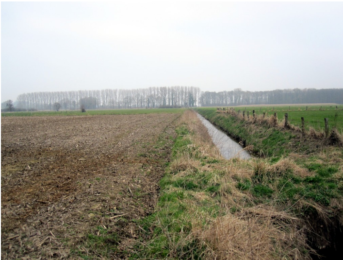
Entwässerungsgraben "Mittelley" im Uedemerbruch (2011)