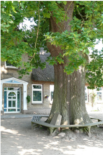
Gedenkeiche und Gedenkstein vor der Grundschule in Groß Wittensee (2020)