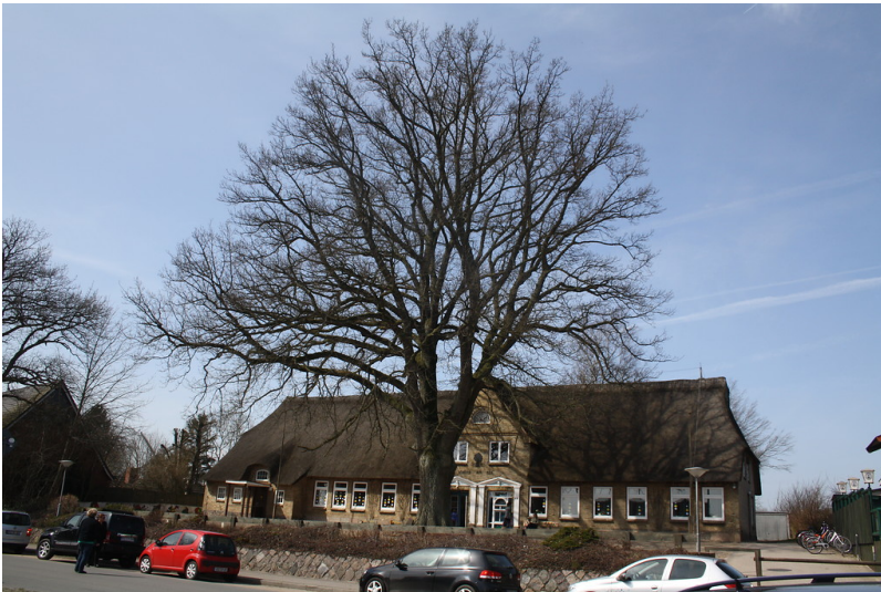
Friedenseiche in Groß Wittensee, Landkreis Rendsburg-Eckernförde, auf dem Hof der Grundschule (2013).