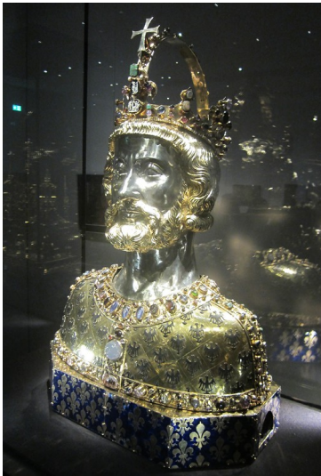
Die um 1350 entstandene Karlsbüste in der Aachener Domschatzkammer, ein Reliquiar in Form der Büste Karls des Großen, in dem dessen Schädeldecke als Reliquie verwahrt wird (2015).