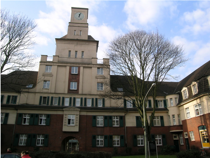
Uhrenturm als Zentrum der Siedlung Hüttenheim I in Duisburg (2005)