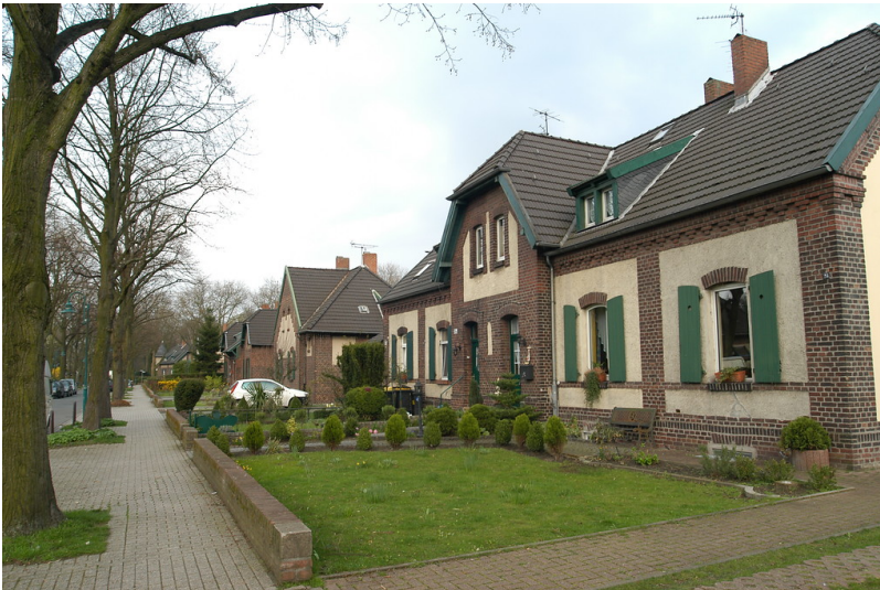
Siedlung Rheinpreußen (2006)