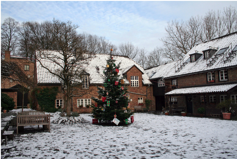
Hof Schlickum (2012)