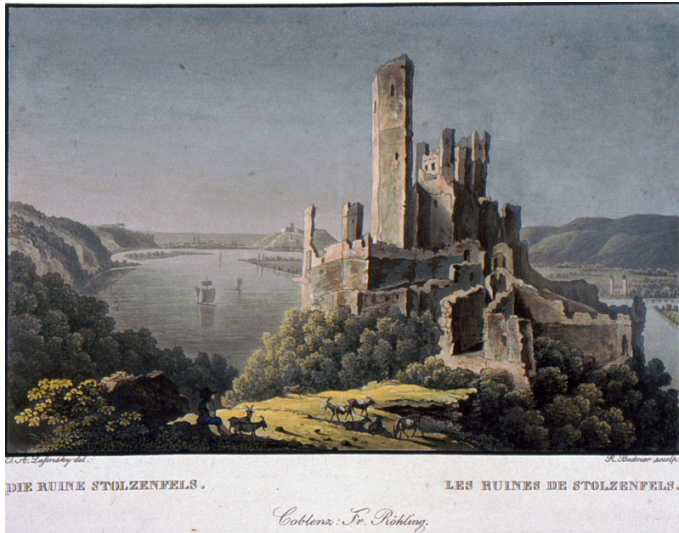
Historische Postkarte mit der Ruine von Burg Stolzenfels bei Koblenz (R. Bodmer, altkolorierter Aquatinta-Stich nach einer Vorlage von J. A. Lasinsky, um 1830) Fotograf/Urheber: R. Bodmer; J. A. Lasinsky