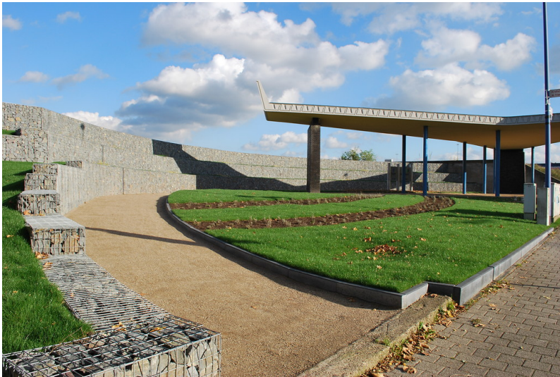
Tor 1 des ehemaligen Krupp Hüttenwerks Rheinhausen nach der Umgestaltung im Oktober 2013.