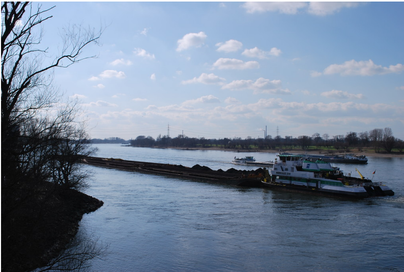
Rhein an der Angermündung in Duisburg (2012)